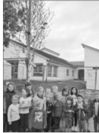
Der Maibaum steht, juhu hurra!

Täglich begrüßt uns nun ein farbenfroher geschmückter Maibaum beim Eintreffen. Zu verdanken haben die Besucher und Gäste des Kindergartens diesen Anblick dem Elternbeirat, der vor allem dem Kindergarten-Team damit eine große Freude macht. Nach zwei Jahren Corona-bedingter Pause fand wieder das traditionelle Weißwurstfrühstück in der Einrichtung statt und viele Eltern nutzten die Gelegenheit zum geselligen Beisammensein.