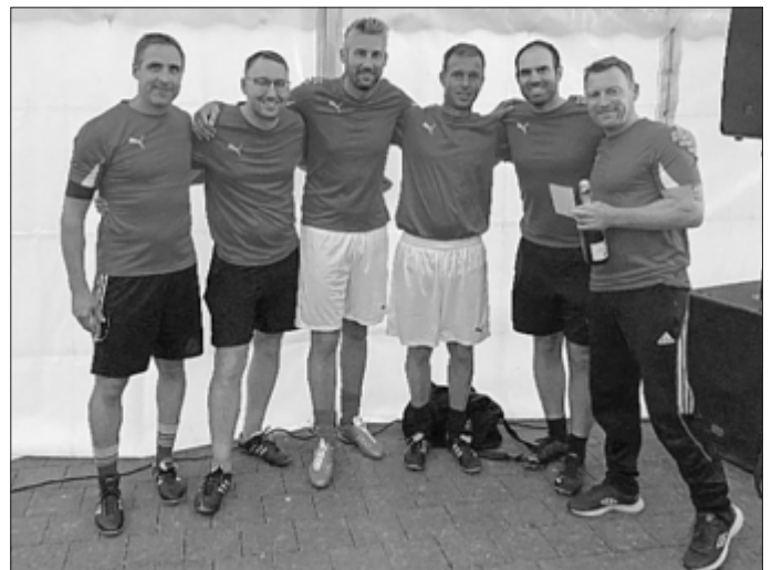
Sieger 11-Meter-Turnier: Feuerwehr Biberach