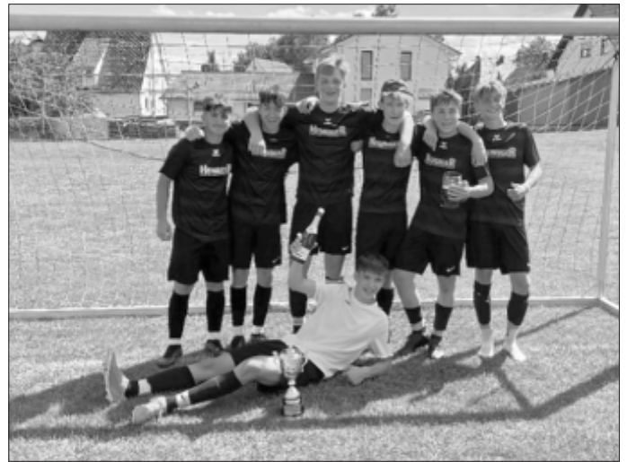
Sieger Vereinsturnier: JFV Jugend Roggenburg

Wir bedanken uns bei allen die mit uns das tolle Jubiläum gefeiert haben. SV BIBERACH E.V.