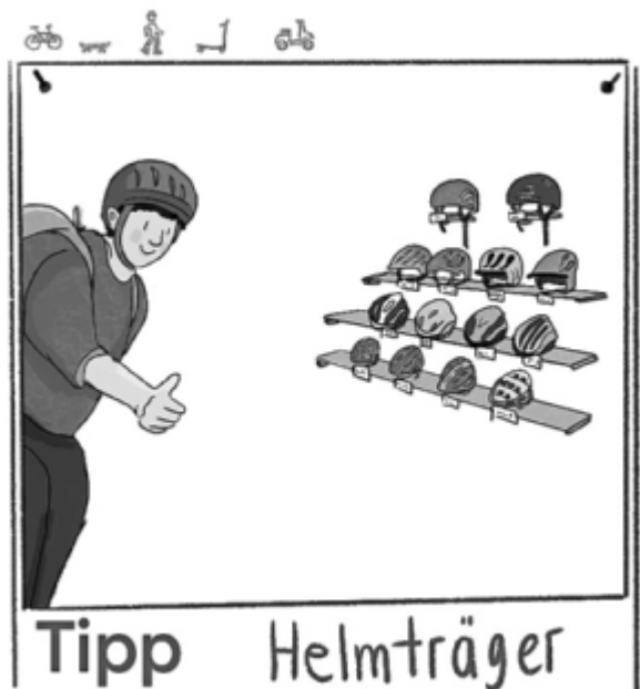
Zeichnung: Esther Schmid, Landratsamt Neu-Ulm