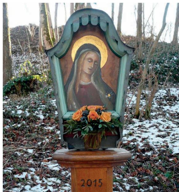
Das Marienbild wurde von Hans Sauter restauriert.

Es ist höchst erfreulich wie bei solchen Aktionen viele Roggenburger Firmen, Handwerksbetriebe, Landwirte und auch Privatpersonen spontan Unterstützung und Mithilfe anbieten. Durch kostenlose Zurverfügungstellung von Maschinen, schwerem Gerät oder erforderlichem Material werden Lösungen ermöglicht, die anderenorts meist große Probleme bereiten.