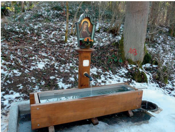
Gesamtansicht der erneuerten Anlage

ist eines von mehreren idyllischen und geschichtsträchtigen Objekten rund um das Klosterareal.